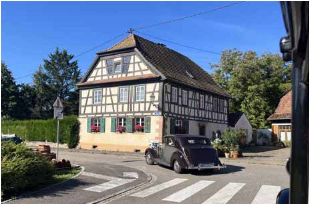
Wolfgang Grau im vollgepackten Wraith im Fachwerkland Elsass.