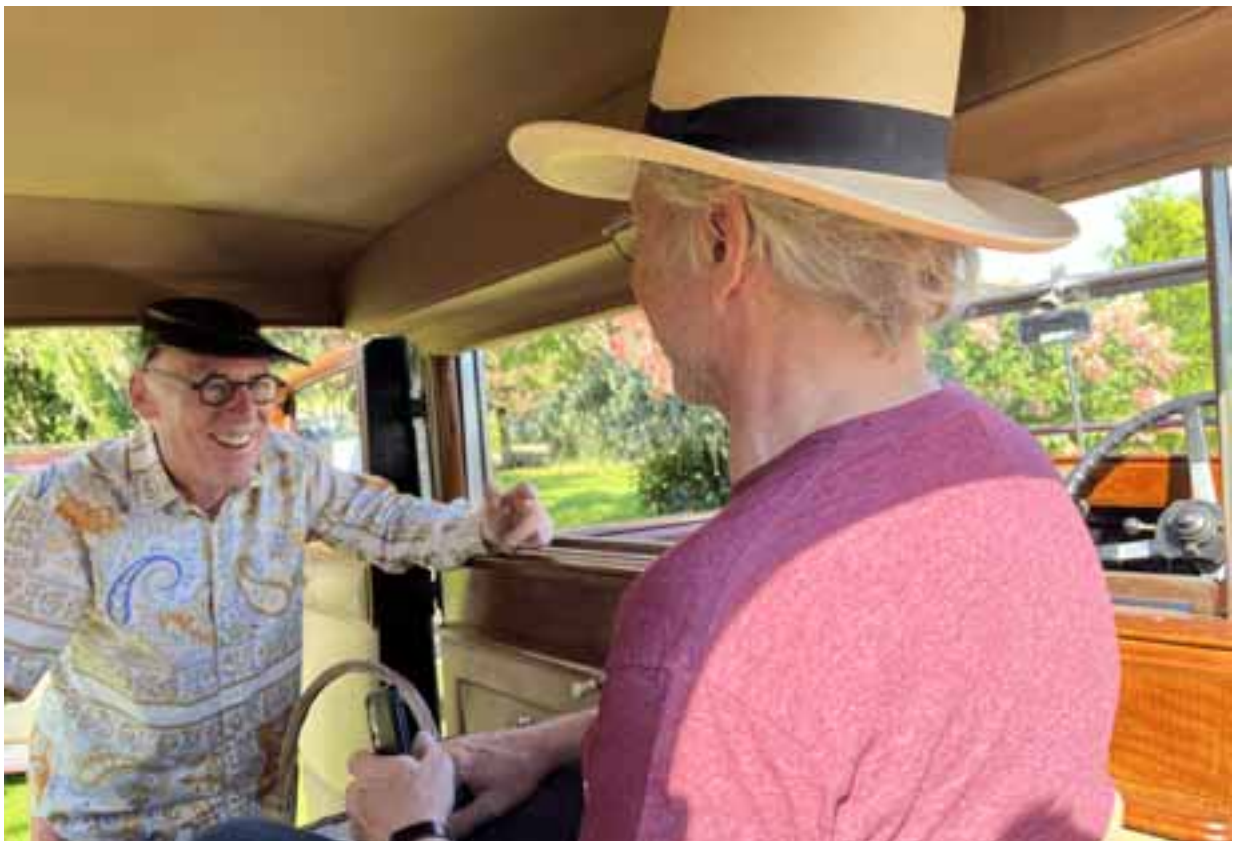
Vorfreude aufs Mittagessen. Was anderes fällt mir zu diesem Bild nicht ein.