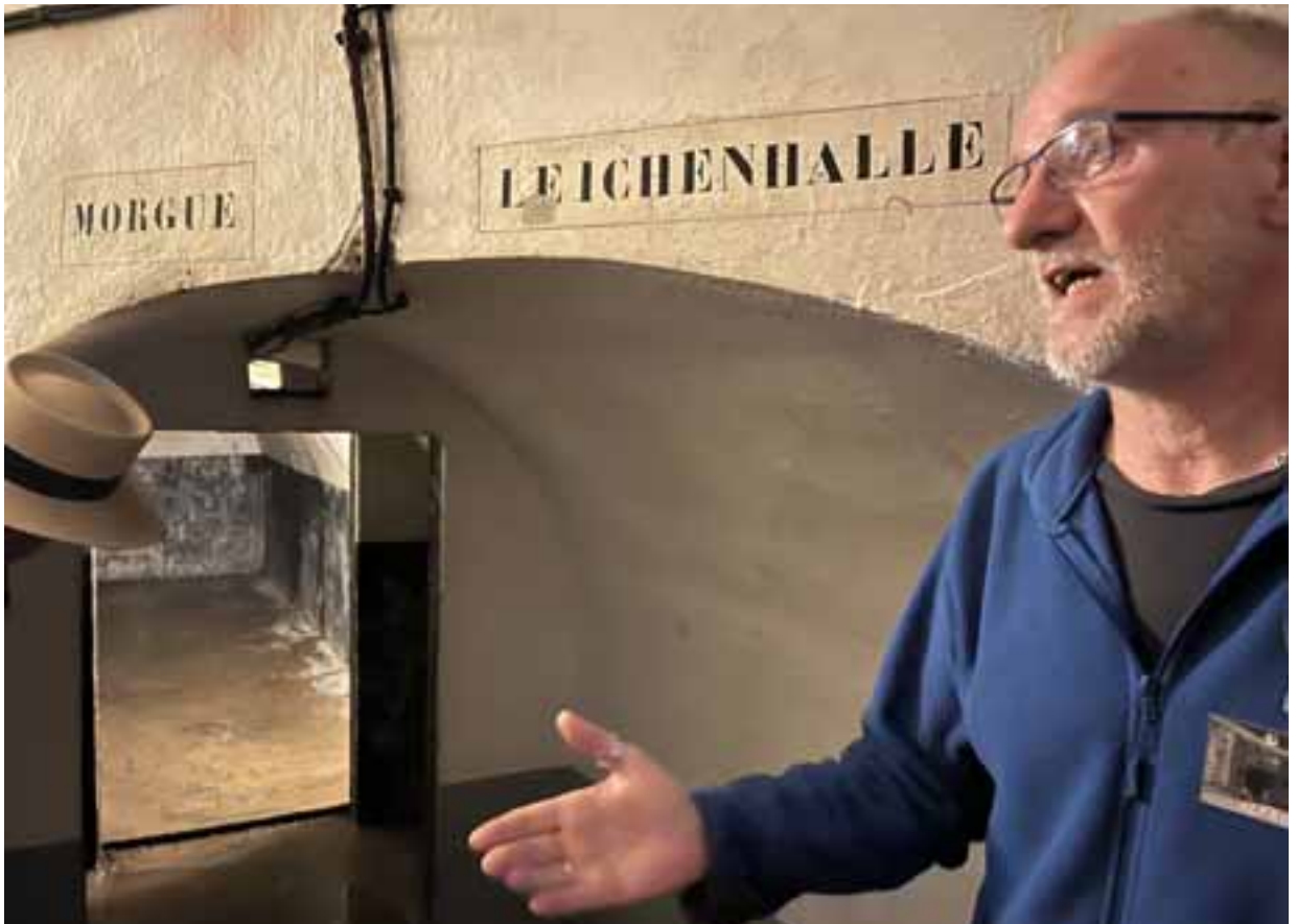
Hier war einst der bittere Ernst des Lebens zu Hause.