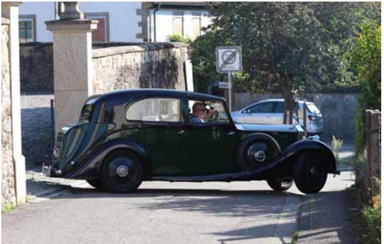
Meiers Rolls-Royce 25/30, Windovers Sedanca de Ville, Chassis-Nr. GRM1, Bj. 1936