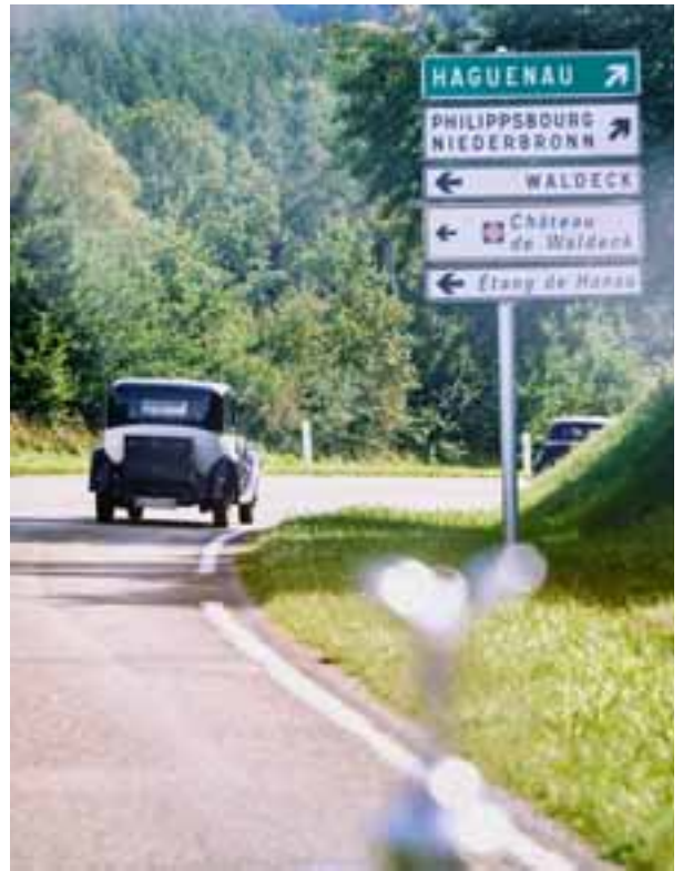
Felix zeigt Flagge. Aber nur im Auto. Was sollen die „Frogs“ sonst sagen?