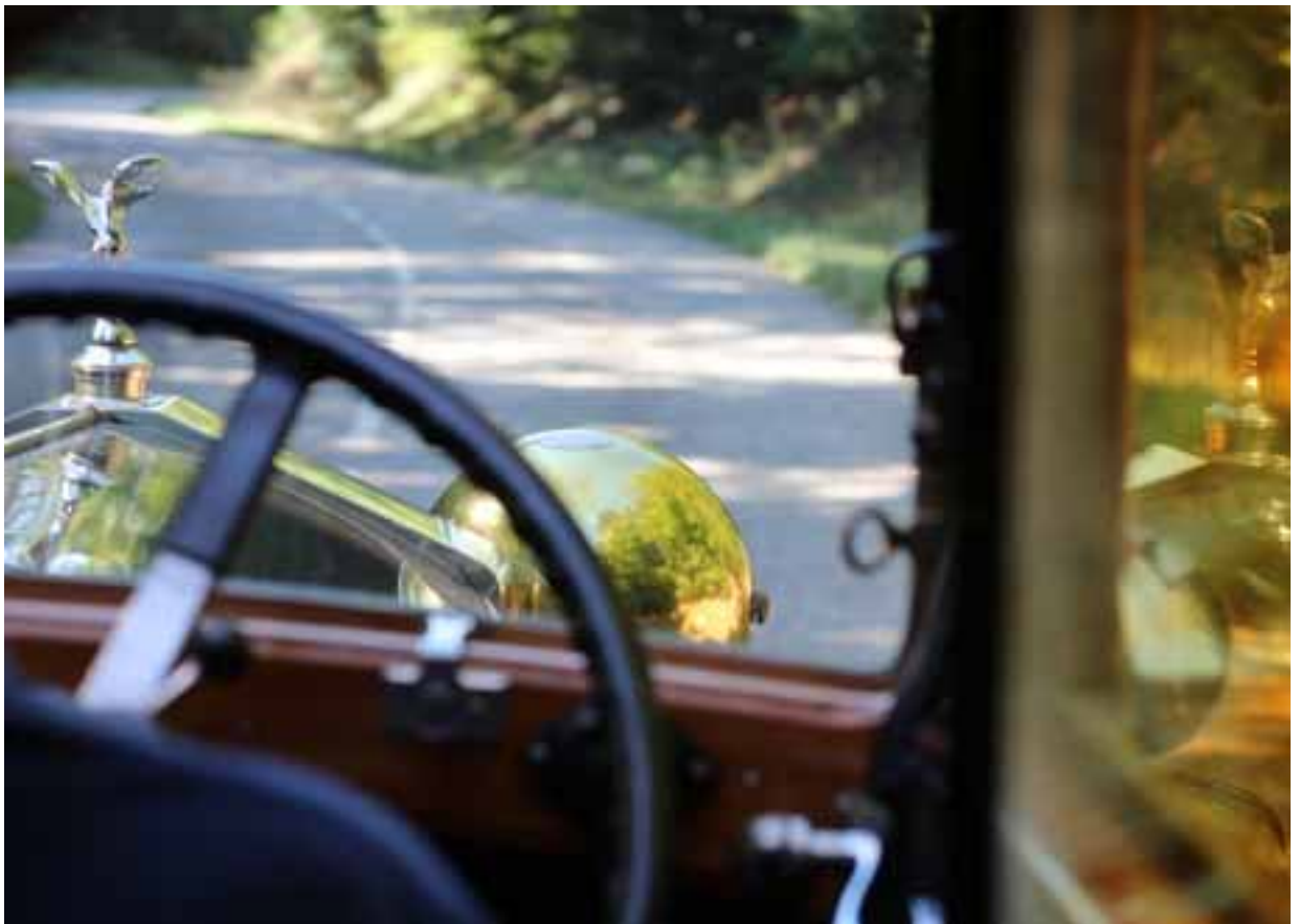
Unverwechselbare Details verraten, in welchem Auto der Fotograf hier mitfahren darf.