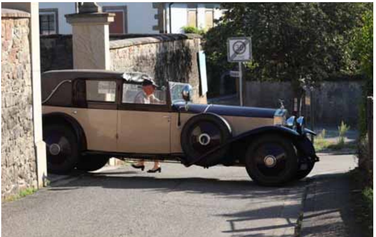
Der Hoedtsche Rolls-Royce Phantom II, Barker „Sports“ Sedanca de Ville, Chassis-Nr. 81XJ, Bj. 1929. Betont niedrig, Sportwagenkotflügel, Einzeltrittbretter, gigantischer Suchscheinwerfer.