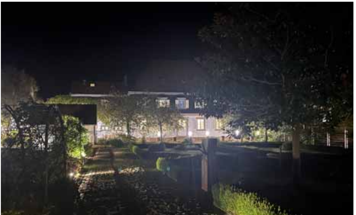
Unser Wochenenddomizil: das Schlössl im südpfälzischen Oberotterbach an der französischen Grenze.