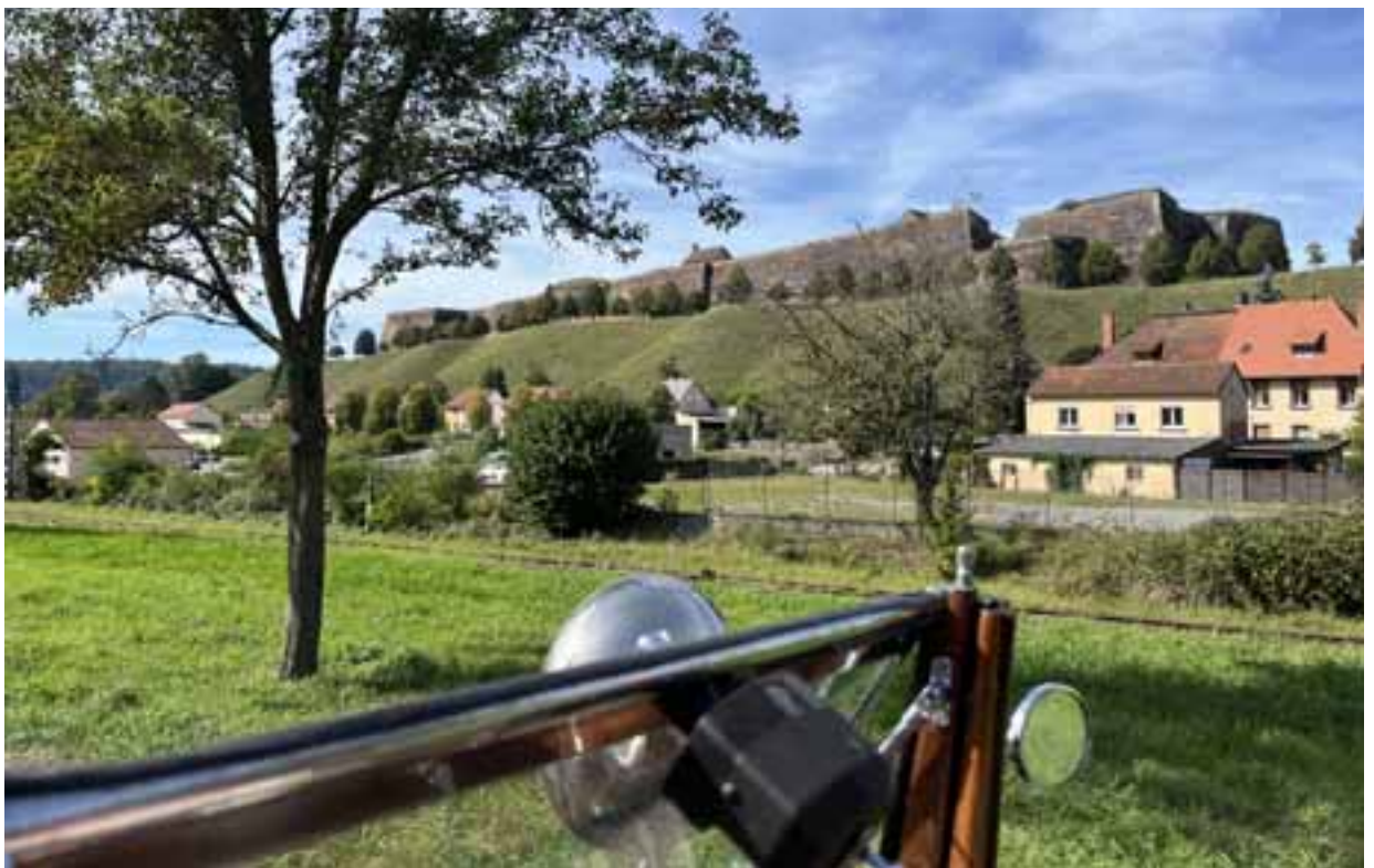
Die Zitadelle von Bitche, aka Bitsch, die vom „Roi Soleil“ bis zur Pickelhaube schon so manch ungebetenen Besucher gesehen hat.