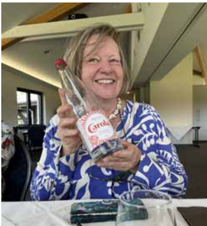
Ja Carola, darauf kann man sich etwas einbilden, wenn man Eau minérale mit dem eigenen Namen serviert bekommt!